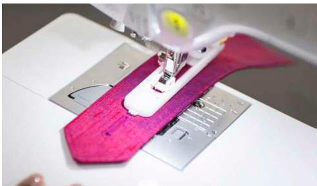
10 styles de boutonnières automatiques en 1 étape