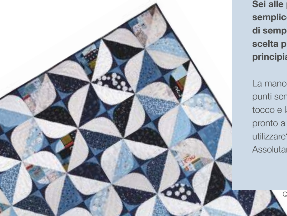
Quilt di Brigitte Heitland, Zen Chic.

Ecco perché abbiamo progettato Serie A, proprio per te. Una famiglia di macchine moderne e dotate di potenti funzioni che ti permettono di affrontare qualsiasi progetto, qualunque sia il tuo stile di cucito.