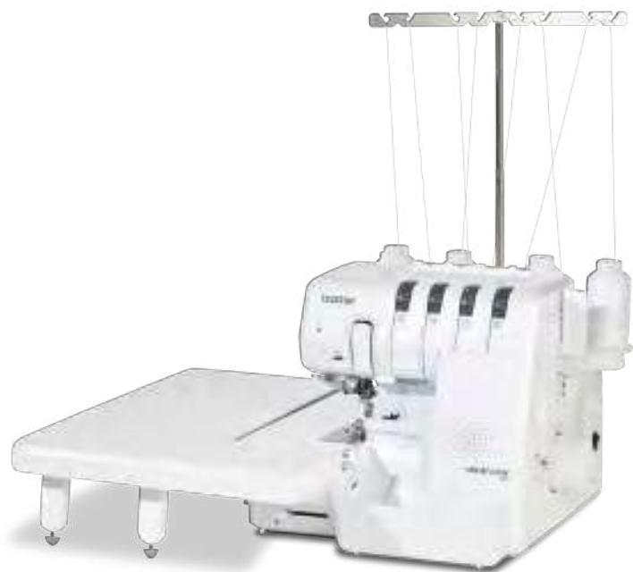
Ampia tavola di prolunga (accessorio opzionale venduto separatamente)