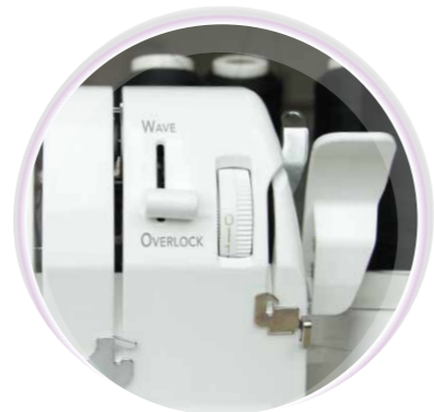
Komfortabel ausgerichteter Füßchenlüfter