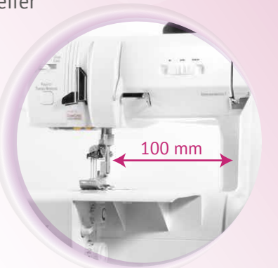
Geschwindigkeitsregelung und besonders breiter Durchlass