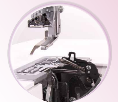
Robuste Greiferkanäle mit klappbarem Hilfsgreifer