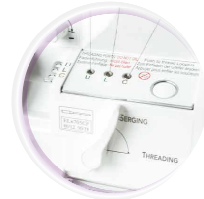
RevolutionAir™ Threading System mit selbsteinfädelnden Greifern