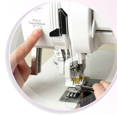
RevolutionAir™ Threading System erstmalig eine Coverlock mit Nadeleinfädler