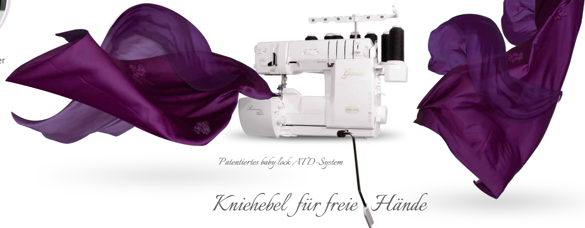
Patentiertes baby lock ATD-System