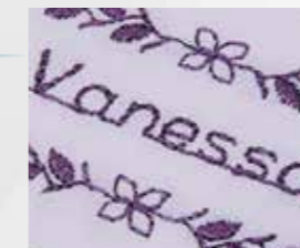
Personalisieren Sie Ihre Nähprojekte mit den Nähschriften.

Spiegeln Sie Stiche horizontal und/oder vertikal für mehr Vielfalt.