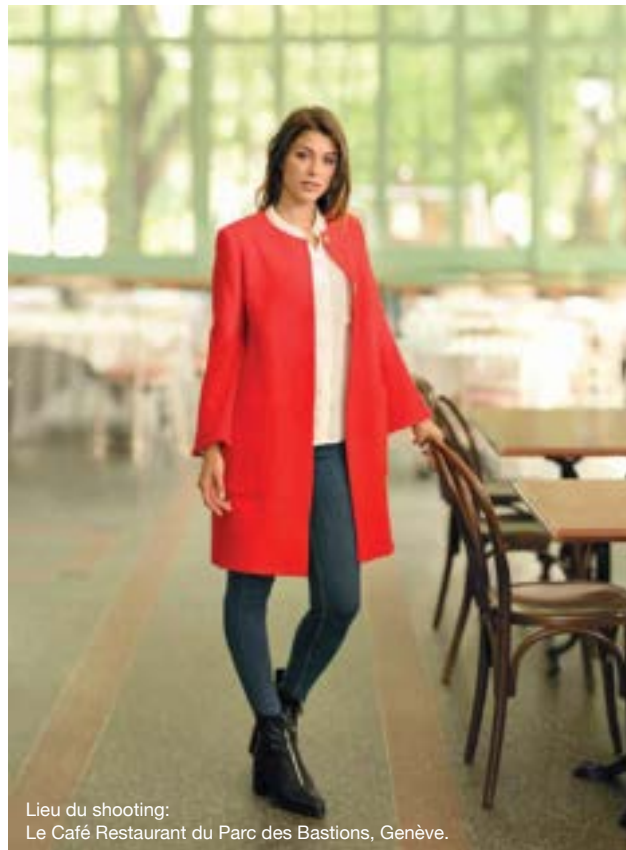
Lieu du shooting: Le Café Restaurant du Parc des Bastions, Genève.

Peu importe que vous recherchiez l'aspect décoratif ou fonctionnel, vous saurez apprécier la précision et la qualité régulière de tous ces points. La fonction mémoire du modèle 570α vous permet de créer des combinaisons de points personnelles et uniques ou de programmer du texte et des noms.