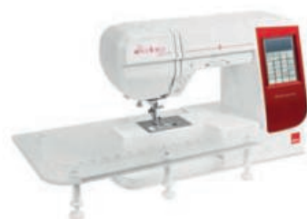
TABLE D'EXTENSION EXTRA-LARGE

Fournie avec nos modèles eXcellence, la table d'extension extra-large vous offre un espace de travail étendu pour réaliser des projets d'envergure (non comprise avec l'eXcellence 770).