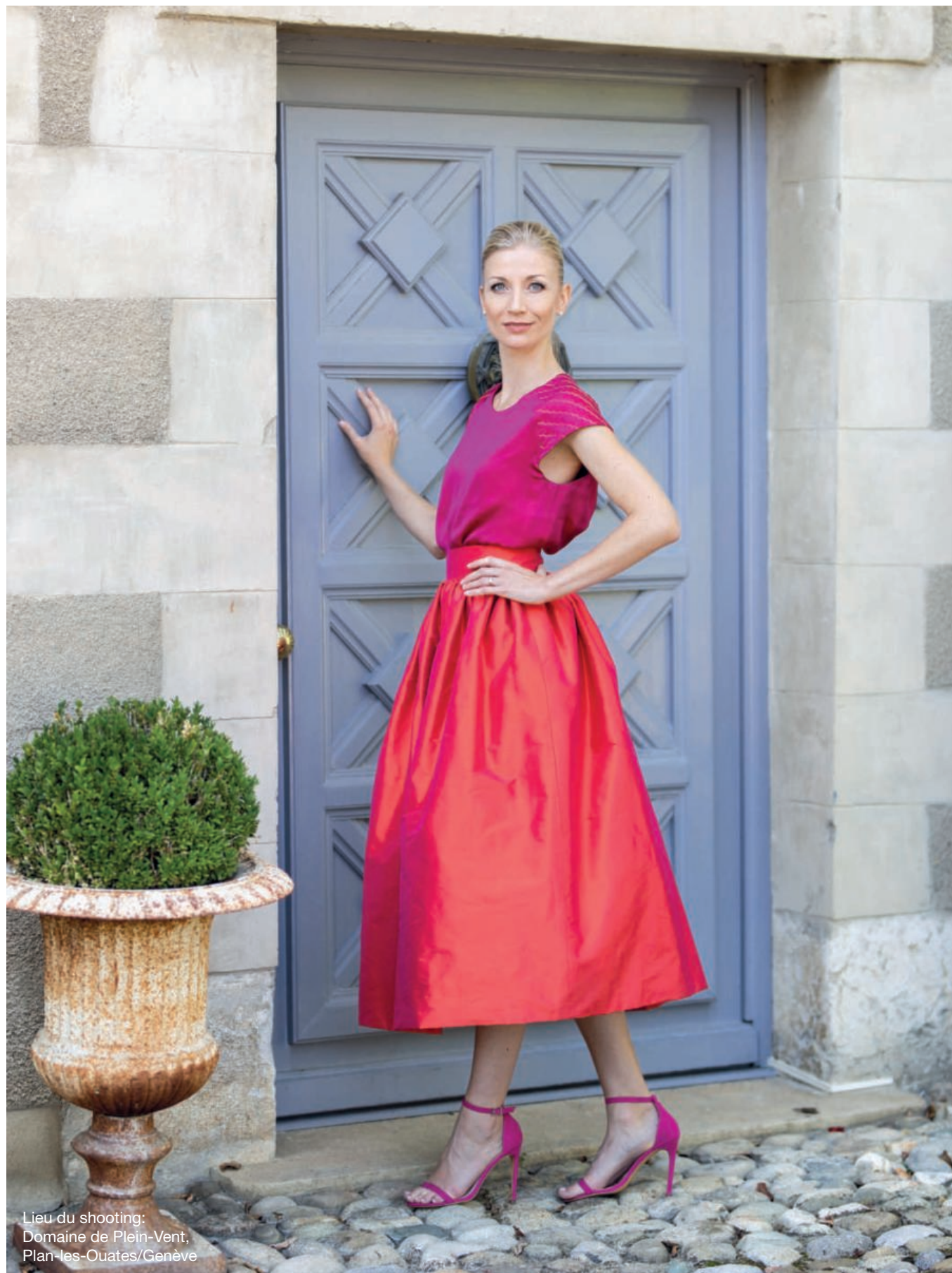
Lieu du shooting: Domaine de Plein-Vent, Plan-les-Ouates/Genève