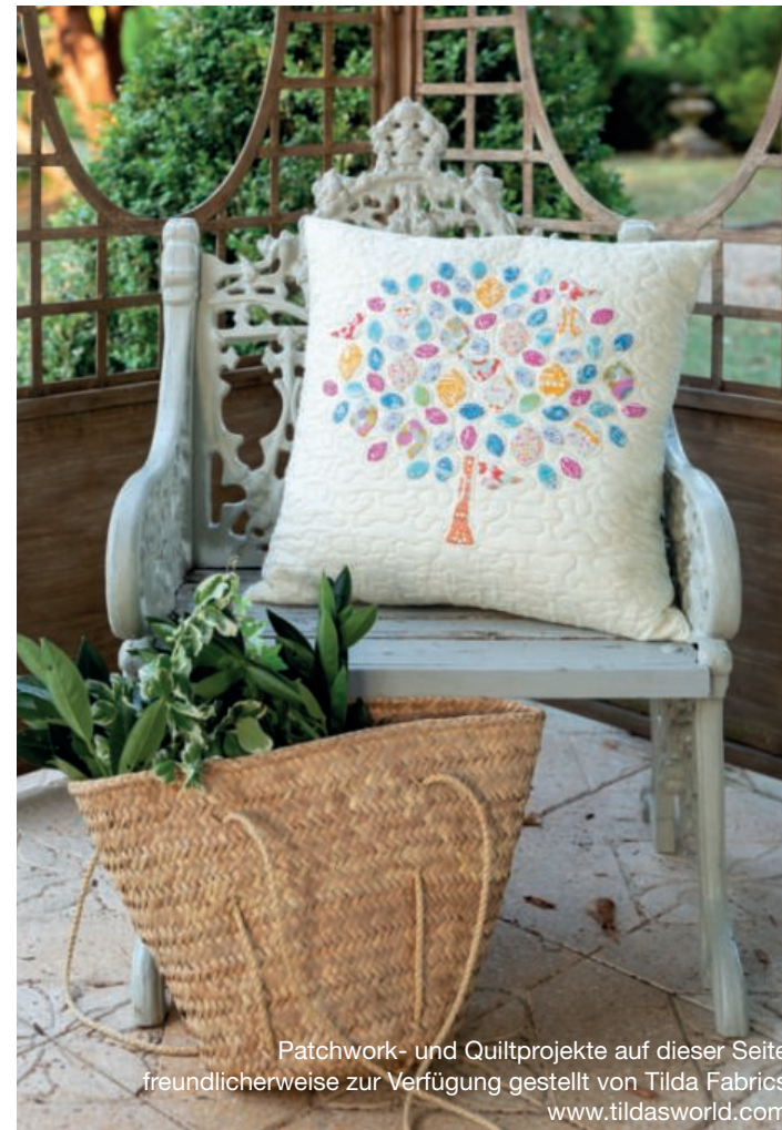
Patchwork- und Quiltprojekte auf dieser Seite freundlicherweise zur Verfügung gestellt von Tilda Fabrics www.tildasworld.com