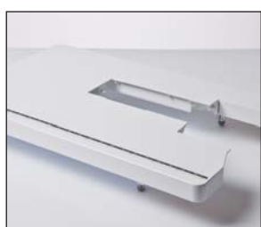
Table d'extension extra-large

Recommandée pour toutes les applications nécessitant une plus grande visibilité. Sa large ouverture permet divers positionnements de l'aiguille à gauche et à droite.